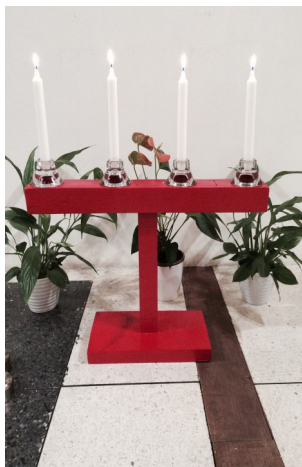
Adventsljus Nacksta S:t Olof kyrka Sundsvall